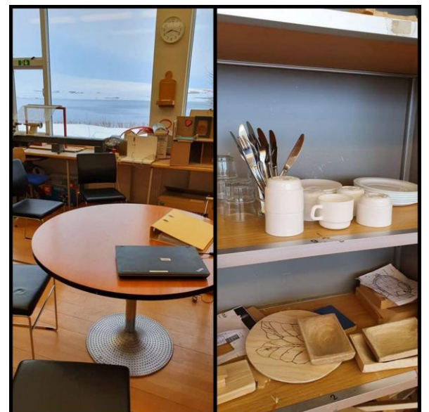
Nýja kaffistofan í smíðastofunni