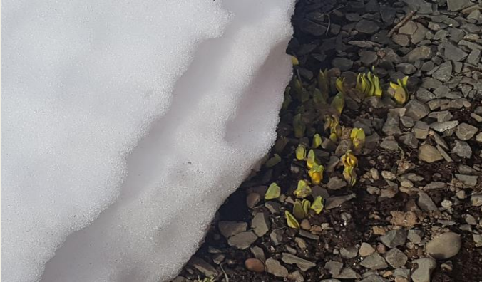
Mynd frá okkur Tátu sveitarstjórati í Ráðhúsinu

Nú þegar snjórinn hefur gefið örlítið eftir birtist okkur vorboðinn sem getur ekki beðið eftir að snjórinn hörfi og sólin nái yfirhöndinni.