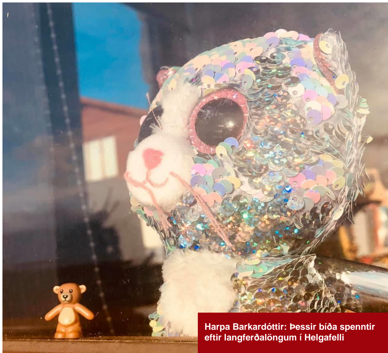
Harpa Barkardóttir: Þessir bíða spenntir eftir langferðalöngum í Helgafelli