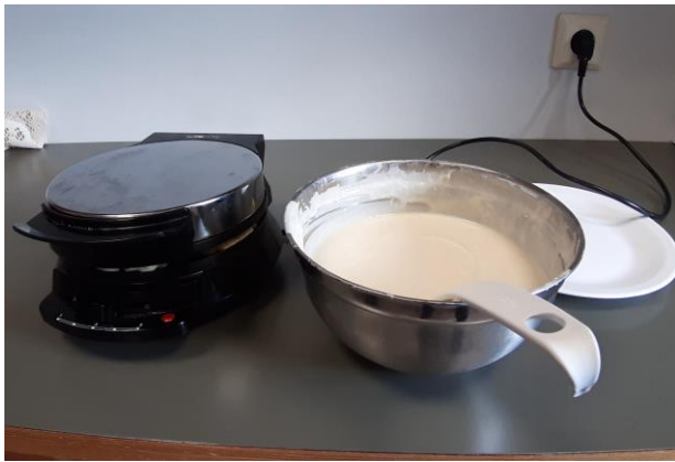
ÖÐRUVÍSI DAGAR: Alþjóðlegur vöfludagur, 25. mars. Að sjálfsögðu voru gerðar vöflur í tilefni dagsins.