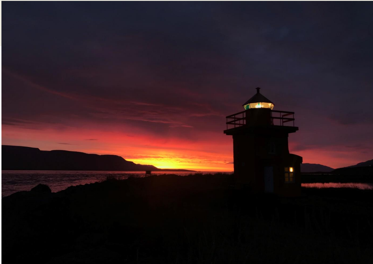
LJÓSMYND AF VITANUM Á SVALBARÐSEYRI Í KVÖLDSÓLINNI.