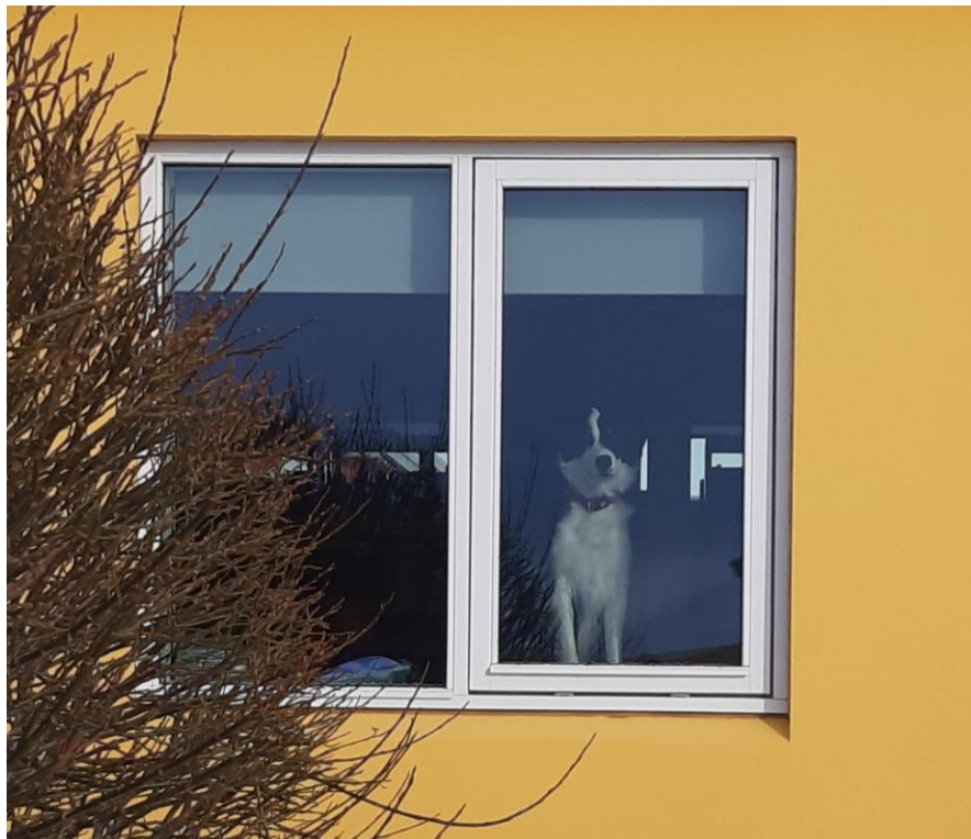
Táta, sveitarstjórátíkin, horfir löngunar augum á krakkana leika úti.