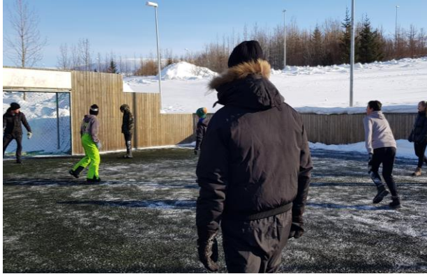
ÖÐRUVÍSI DAGAR: Elstu krakkarnir ein úti í frímínútum að spila fótbolta.

Það er hægur vandi að gleyma sér þegar hafa þarf milljón hluti í huga hvert einasta andartak.