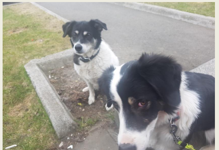
TÁTA OG KOLKA BÍÐA EFTIR BESTA BITANUM OG ÞEIM HOLLASTA