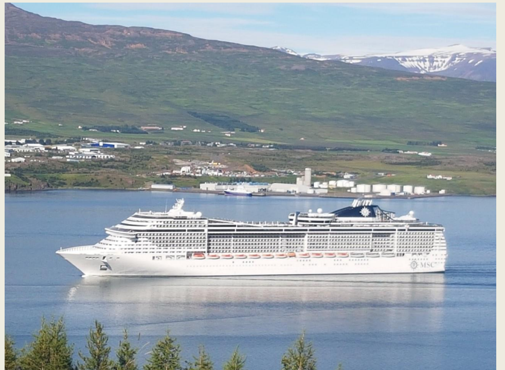
PREZIOSA 3.500 FARÞEGAR.