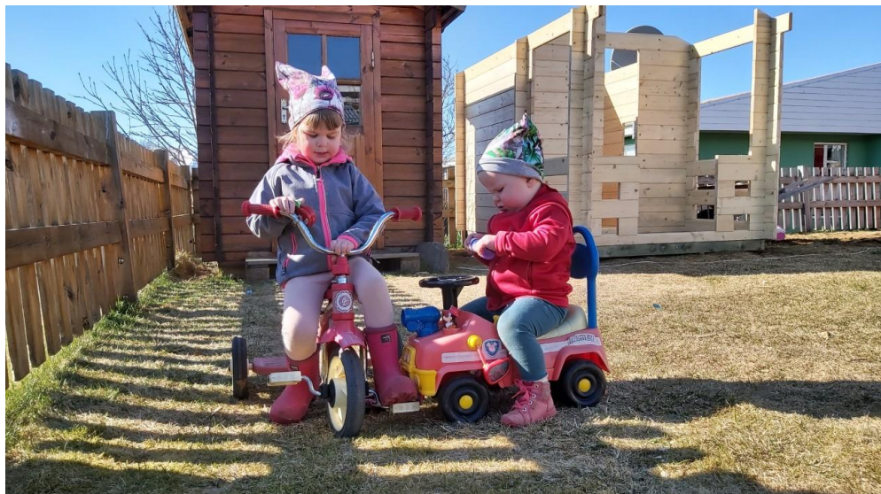
DÆTUR ÖLMU HEILSA SUMRI