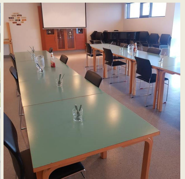
MYND AF MATSALNUM EFTIR AÐ BÚIÐ VAR AÐ LEGGJA Á BORÐ