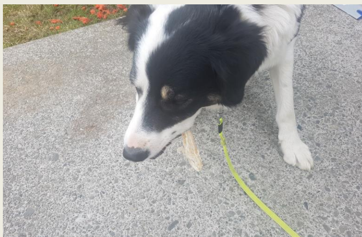
TÁTA RÍFUR HARÐFISKSTYKKIÐ Í SUNDUR, SVO HÚN GETI GEFIÐ KOLKU MEÐ SÉR.