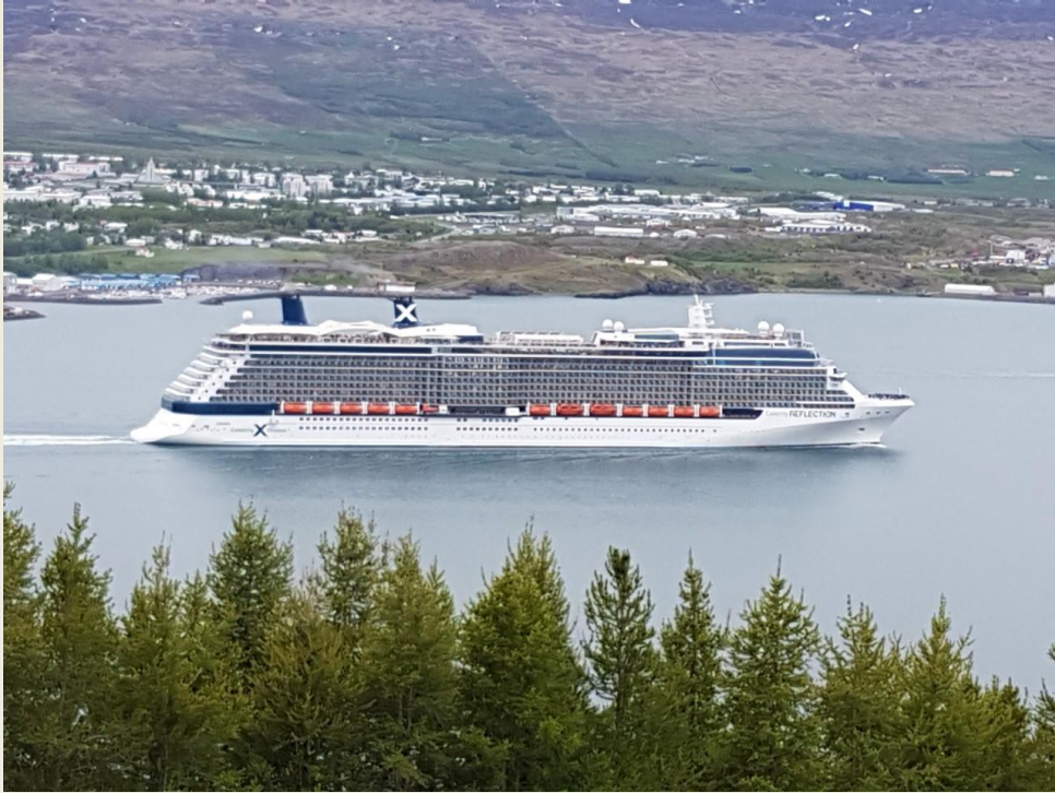
CELEBRITY REFLECTION 3000 FARÞEGAR.

Okkar þjónusta hefur að mestu leyti verið við erlenda gesti, aðal markhópurinn yfir sumarið hefur verið farþegar á skemmtiferðaskipum, sem ýmist hafa bókað í gegnum okkar heimasíðu eða í gegnum aðrar ferðaskrifstofur bæði erlendar og íslenskar.