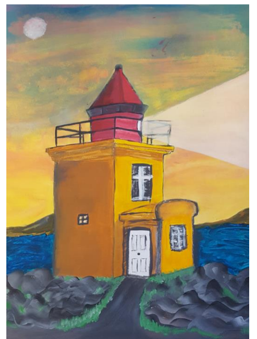
HANN LÆTUR KANNSKI LÍTIÐ YFIR SÉR, VITINN Á SVALBARÐSEYRI, EN EF BETUR ER AÐ GÁÐ SÉST HVE STÓRFELLD HÆTTA GÆTI STAFAB AF HONUM.