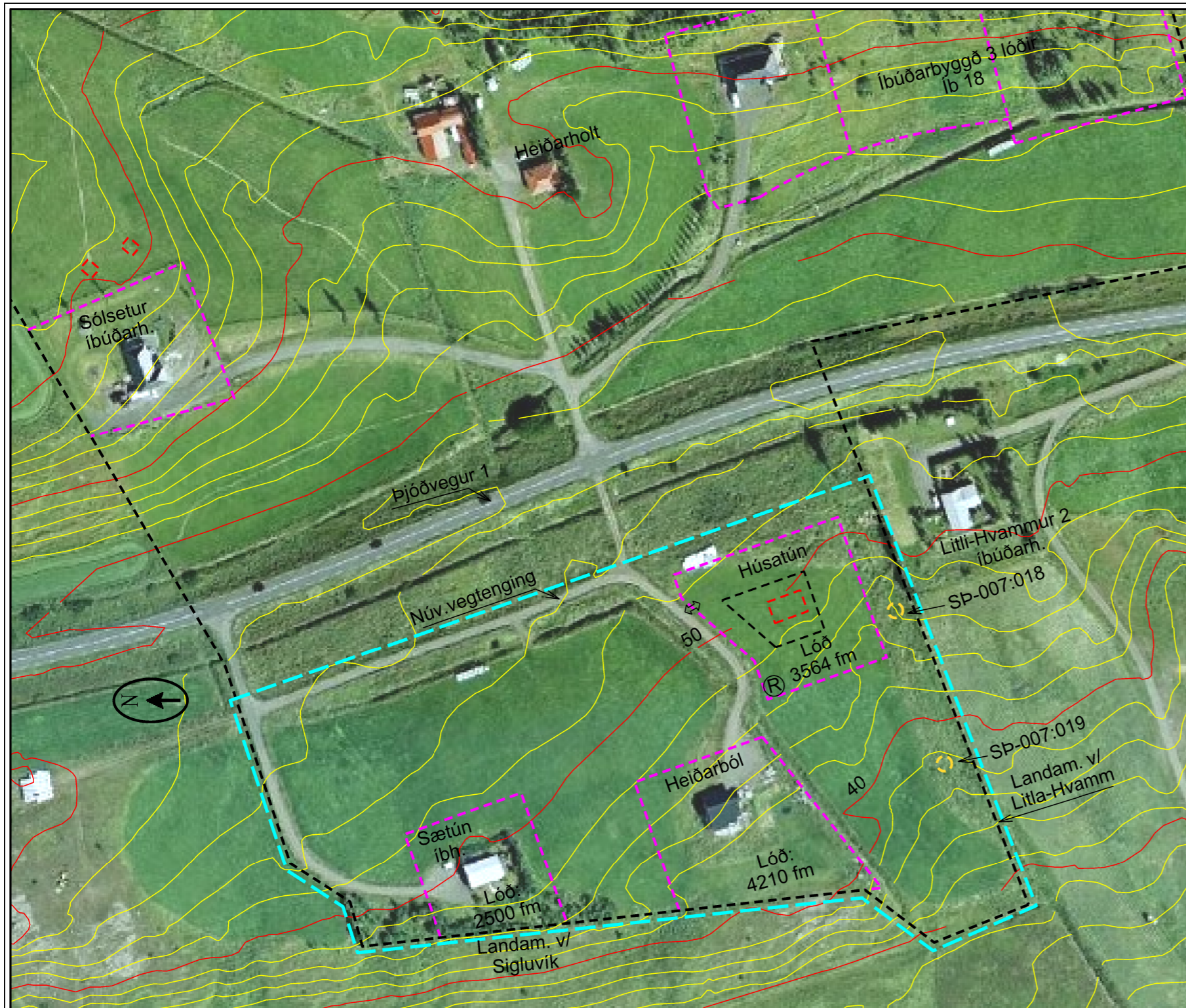
Deiliskipulagstillaga mkv. 1:2000