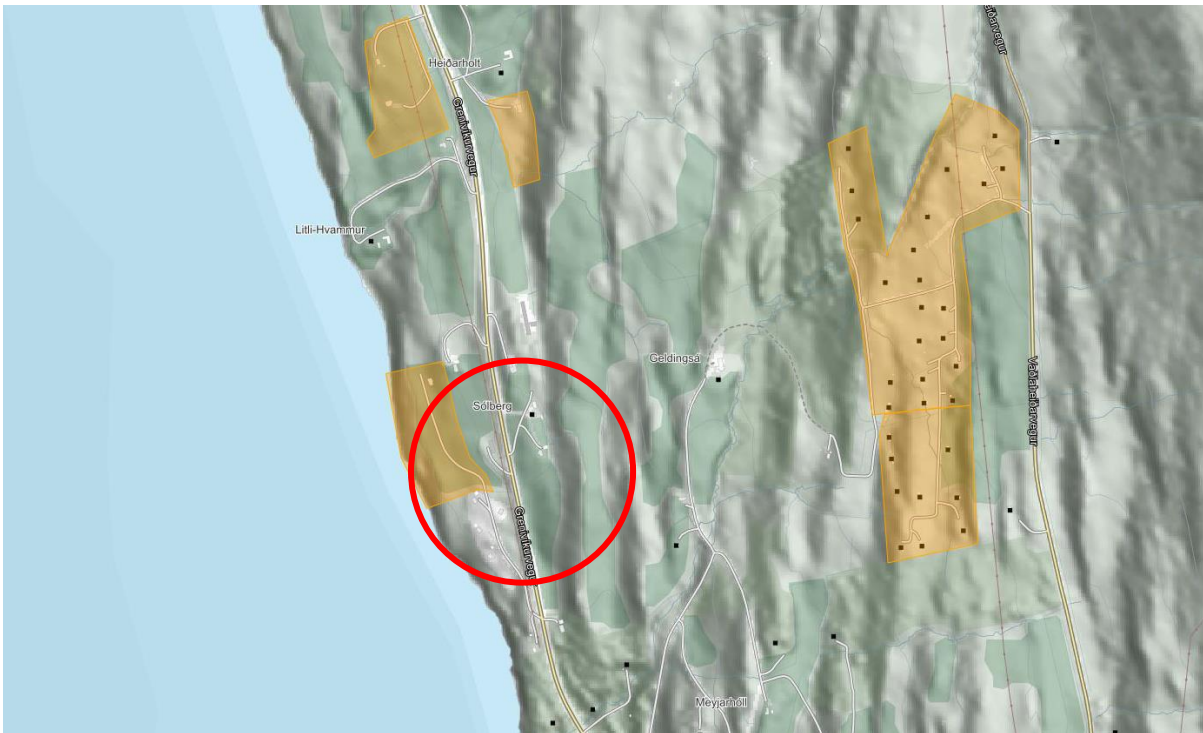
Mynd 3. Deiliskipulög nálægt svæðinu.