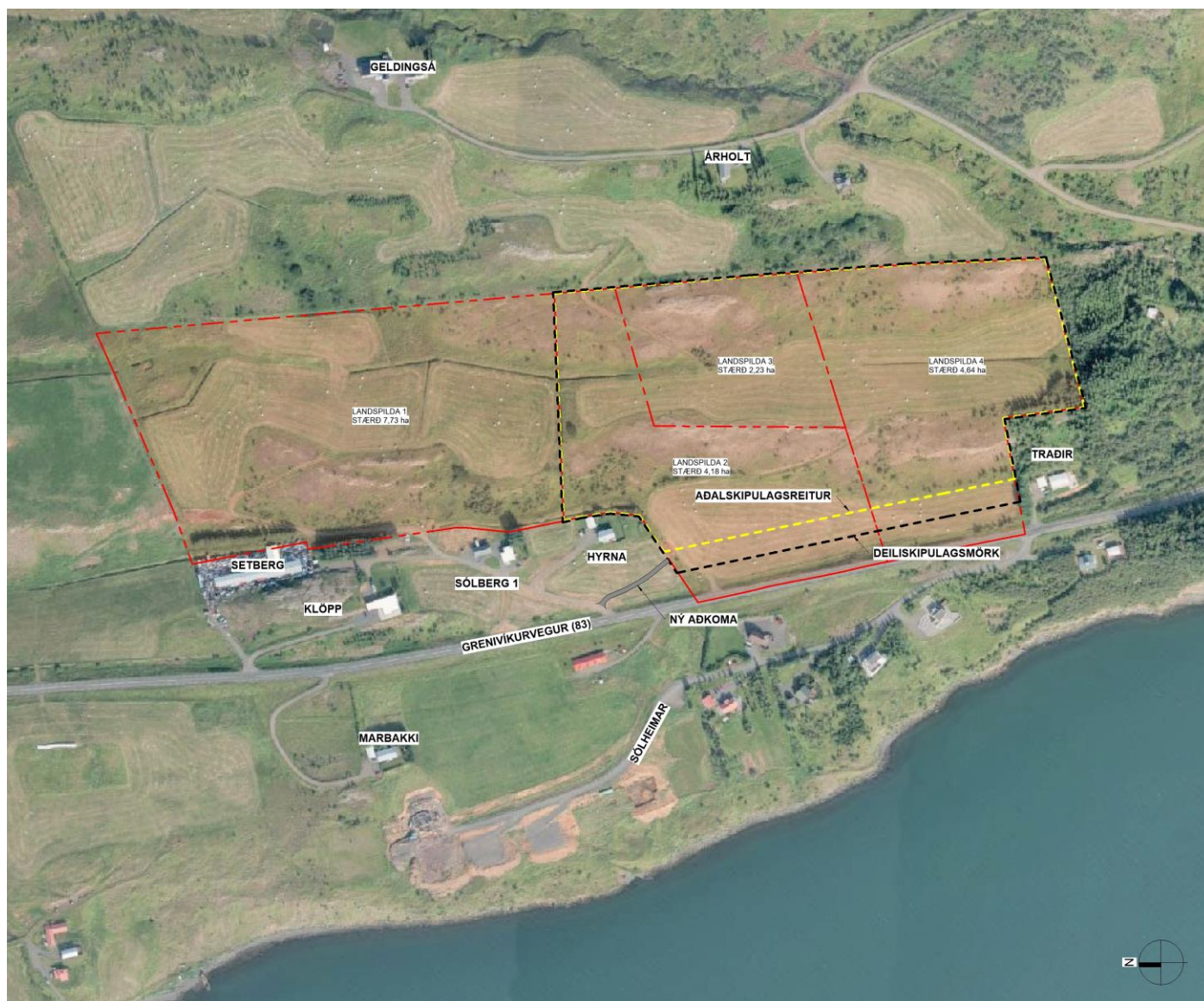
Mynd 1 Skýringarmynd af skipulagssvæðinu.

Til stendur að skipta landi Sólbergs ofan Þjóðvegur í 4 landspildur. Skipulagssvæðið nær til þriggja landspildna, eða um 10,16 ha svæði. Gerðar verða tvær lóðir í landspildu 2. Deiliskipulagsreiturinn nær að veghelgunarsvæði Grenivíkurvegar en nýr aðalskipulagsreitur 50 m frá miðlínu vegsins. Nýi aðalskipulagsreiturinn verður 9,5 ha.