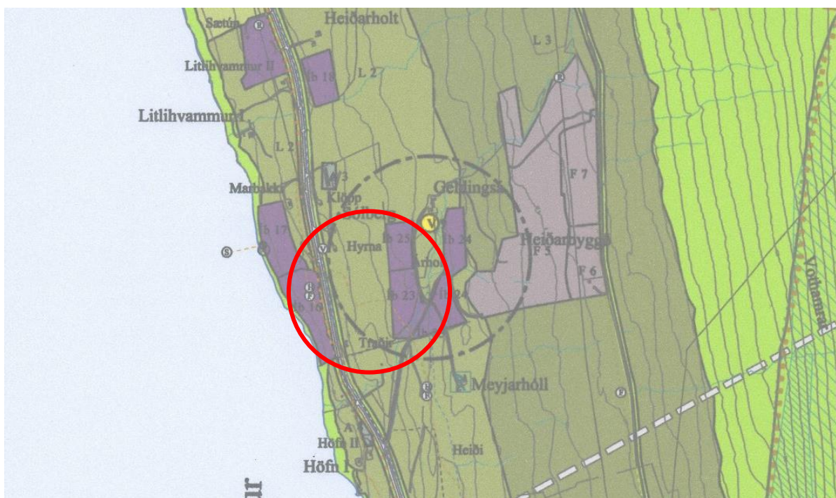
Mynd 2. Hluti úr aðalskipulagi Svalbarðsstrandarhrepps 2008-2020, með breytingu frá apríl 2021.

Í apríl 2021 var staðfest aðalskipulagsbreyting á landi Geldingsár og er deiliskipulag í vinnslu fyrir það svæði.