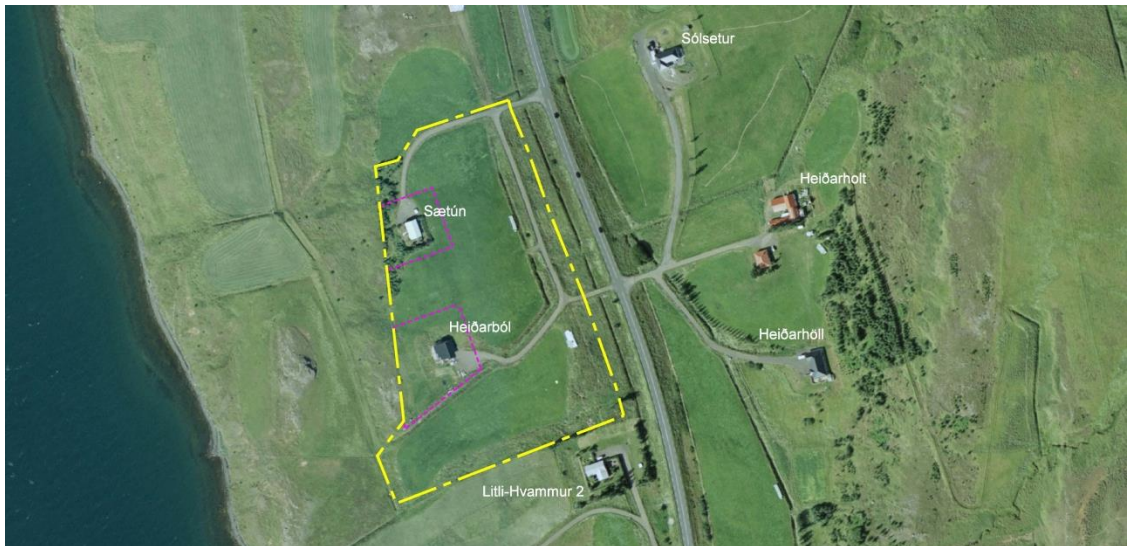
Mynd 1: Loftmynd sem sýnir staðhætti og afmörkun fyrirhugaðs landnotkunarreits fyrir íbúðarbyggð.

Svæðið er í landi Heiðarholts, neðan Þjóðvegur 1, og er aðkoma frá Þjóðvegi um veg nr. 8517. Svæðið er í stuttri fjarlægð frá þéttbýli þar sem hægt er að sækja atvinnu, verslun og þjónustu. Þaðan eru um 4,5 km til Svalbarðseyrar og 9 km til Akureyrar.