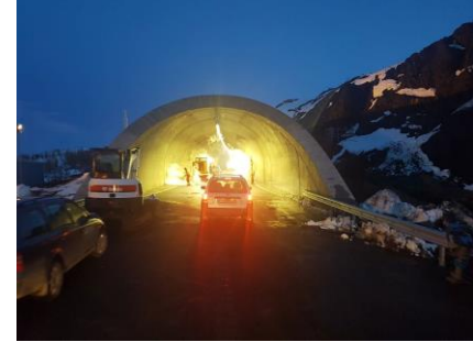
Ljósmynd: Björg Erlingsdóttir